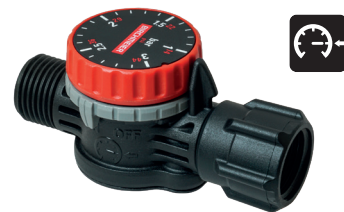
Einstellbares Druckreglventil PR 3