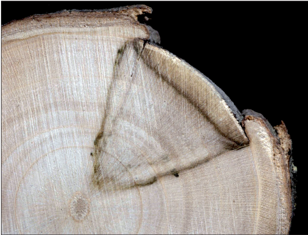
1. schwächere Abschottung infolge einer Sonnenbrandnekrose

Welche Schäden ohne oder durch ungeeigneten Stammschutz auftreten können, zeigen die beiden folgenden Abbildungen: