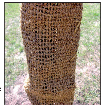
licht- und luftdurchlässig

Einbau: unmittelbar nach dem Pflanzen des Jungbaumes. Der Stammschutz sollte 5 Jahre am Stamm bleiben, um die kritische Anwachs- und Jugendphase des Baumes zu überbrücken; ggf. ist er zu erneuern.