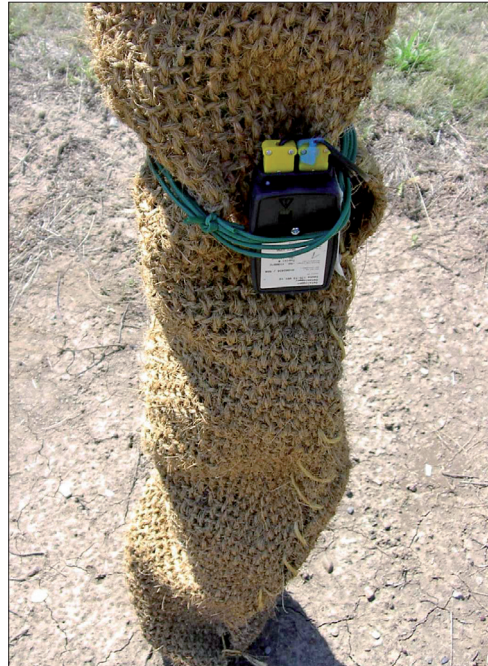
mit Datenlogger im Testfeld, Juli 2006