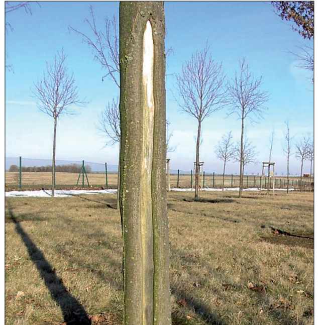
2. Rindennekrose an Ahorn infolge eines echten Frostrisses

Auf Wunsch stellen wir Ihnen gerne Ausschreibungstexte zur Verfügung!